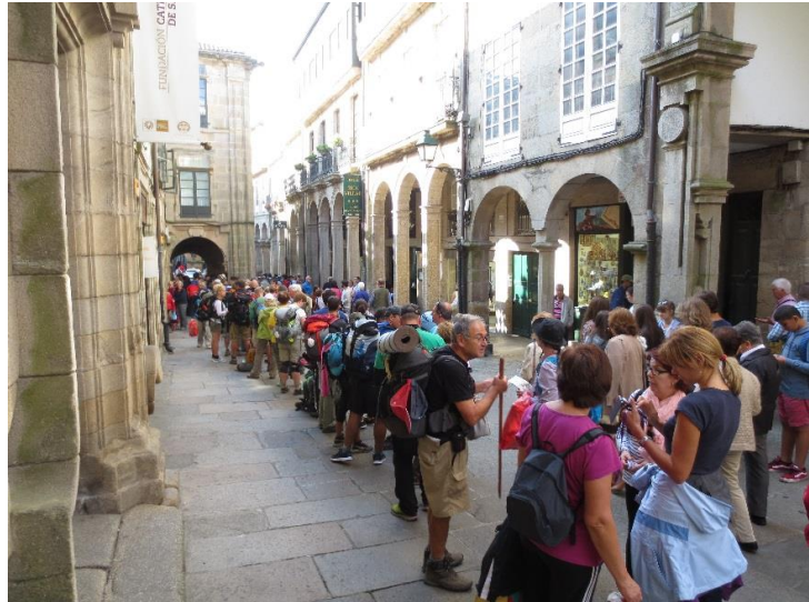
In de rij voor een compostela

Bovenstaande foto maakte ik enkele weken geleden, anderhalf uur wachttijd voor het Pelgrimsbureau (tip: 's ochtends om 8 uur kun je zo doorlopen).